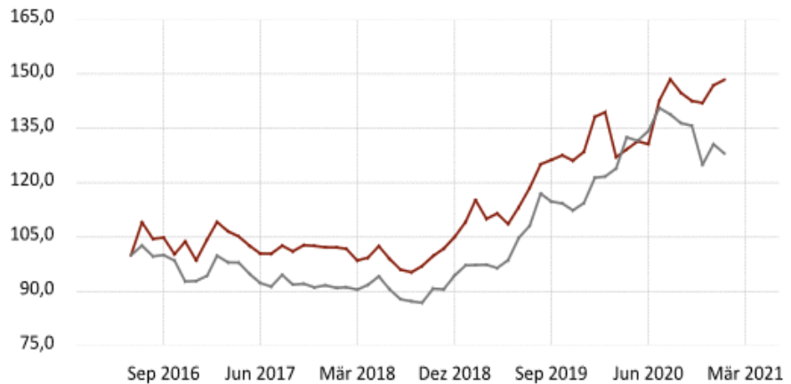
Edelmetall-Sparplan Entwicklung 2016—2020