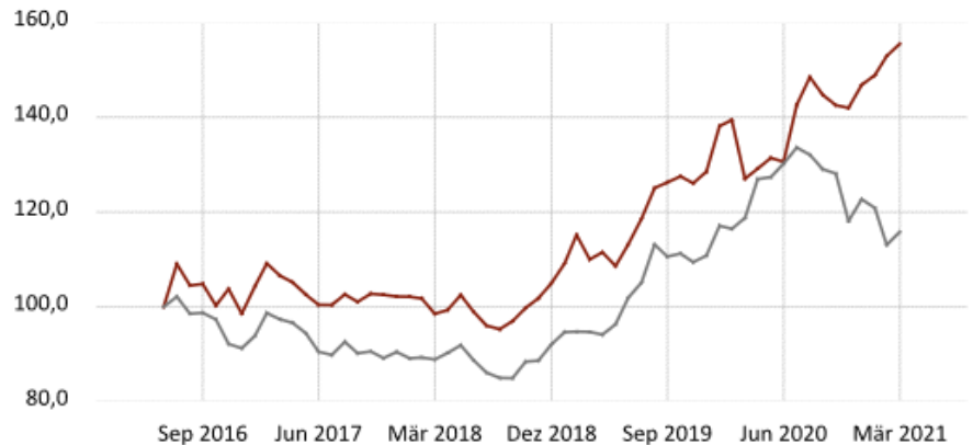
Edelmetall-Sparplan Entwicklung 2016—2021