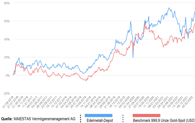
Edelmetall-Depot Entwicklung 2016—2022